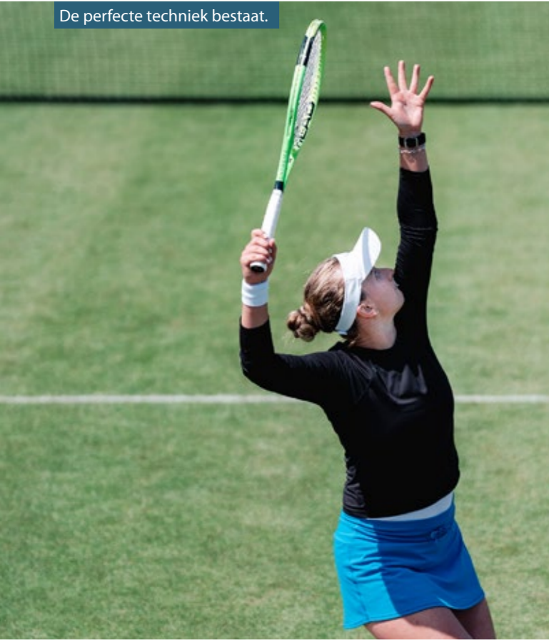
De perfecte techniek bestaat.