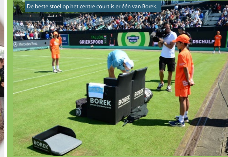
De beste stoel op het centre court is er één van Borek.