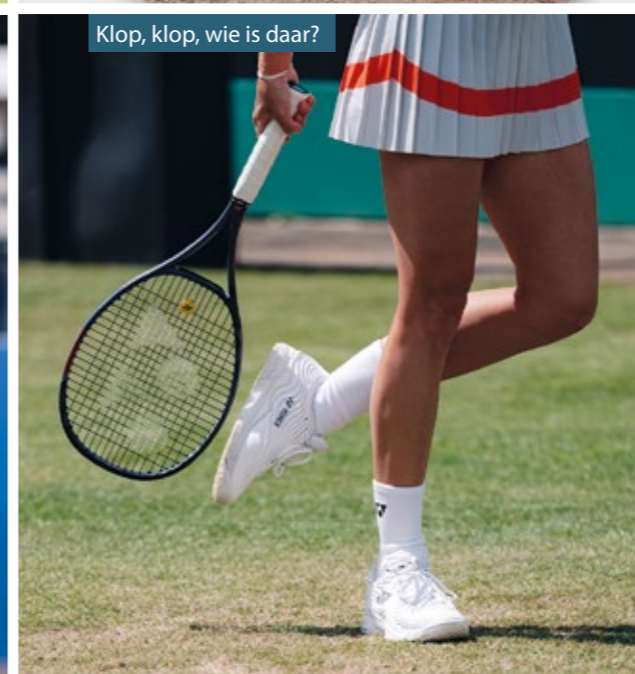
Klop, klop, wie is daar?