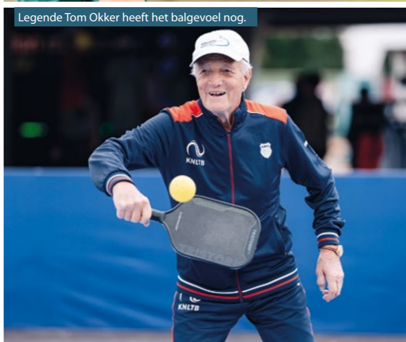
Legende Tom Okker heeft het balgevoel nog.