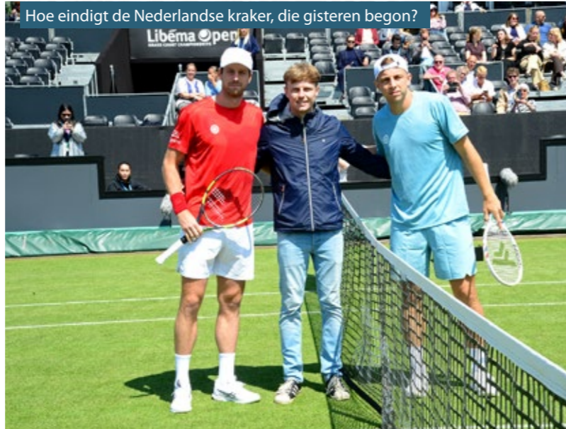
Hoe eindigt de Nederlandse kraker, die gisteren begon?