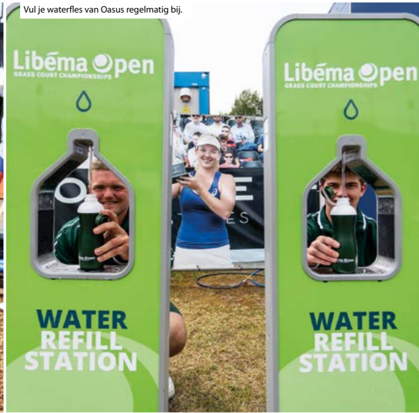
Vul je waterfles van Oasis regelmatig bij.