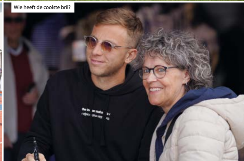
Wie heeft de coolste bril?