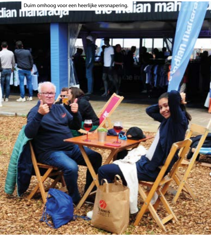
Duim omhoog voor een heerlijke versnapering.