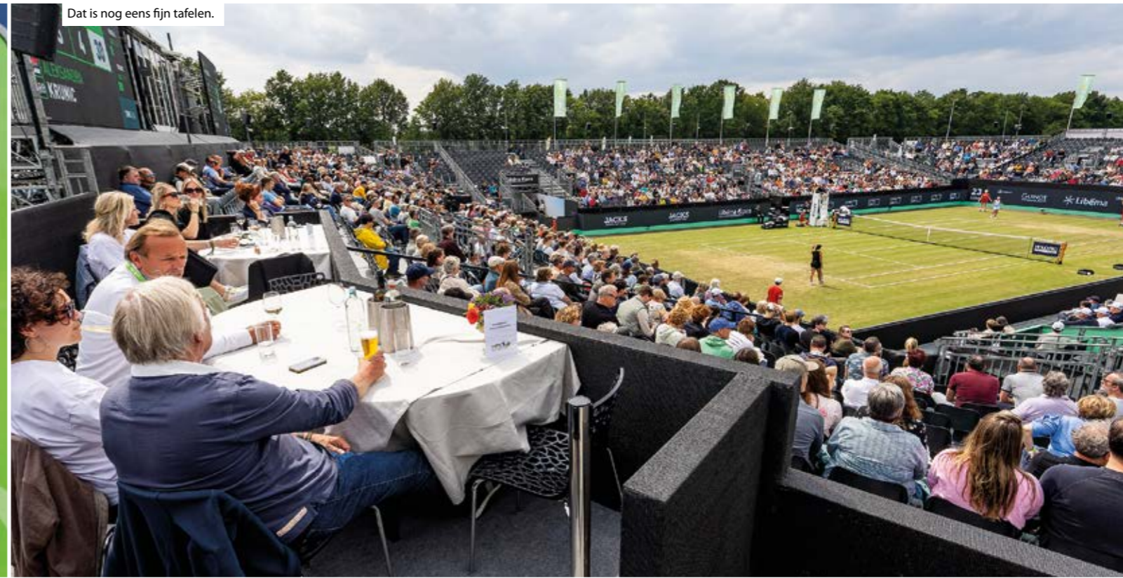
Dat is nog eens fijn tafelen.